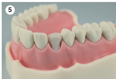
Präparation mit Schmelzanschrägung