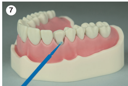
Auftragen eines Adhäsivsystems, z. B. Harvard InterLock ONE