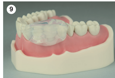
Korrekte Reponierung der befüllten Matrix in die Mundhöhle