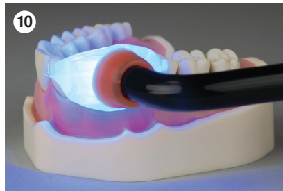
40 Sek. Lichthärtung durch die Matrix. Vorgang nach Entfernen der Matrix wiederholen