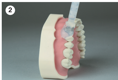
Applikation von Harvard TransMatrix auf die zu präparierende Fläche und Nachbarzähne