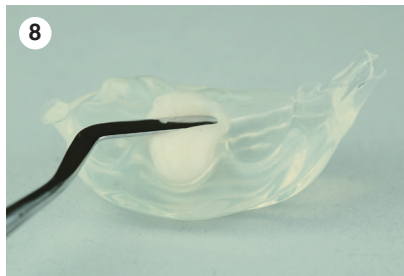
Applikation eines leicht erwärmten stopfbaren Composites in die Matrix, z. B. Harvard UltraFill