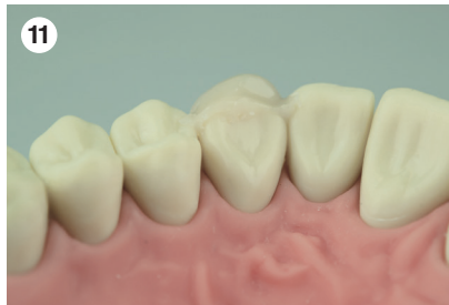
Überschussentfernung und Politur mit geeigneten rotierenden Instrumenten und ggf. Finierstreifen