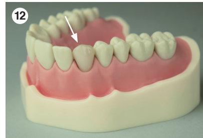
Fertige direkte Composite-Restauration