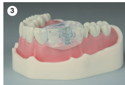
Schnelle Erhärtungszeit (1:20 Min. intraoral)