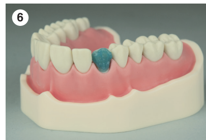
Ätzen der präparierten Fläche mit Harvard Etch